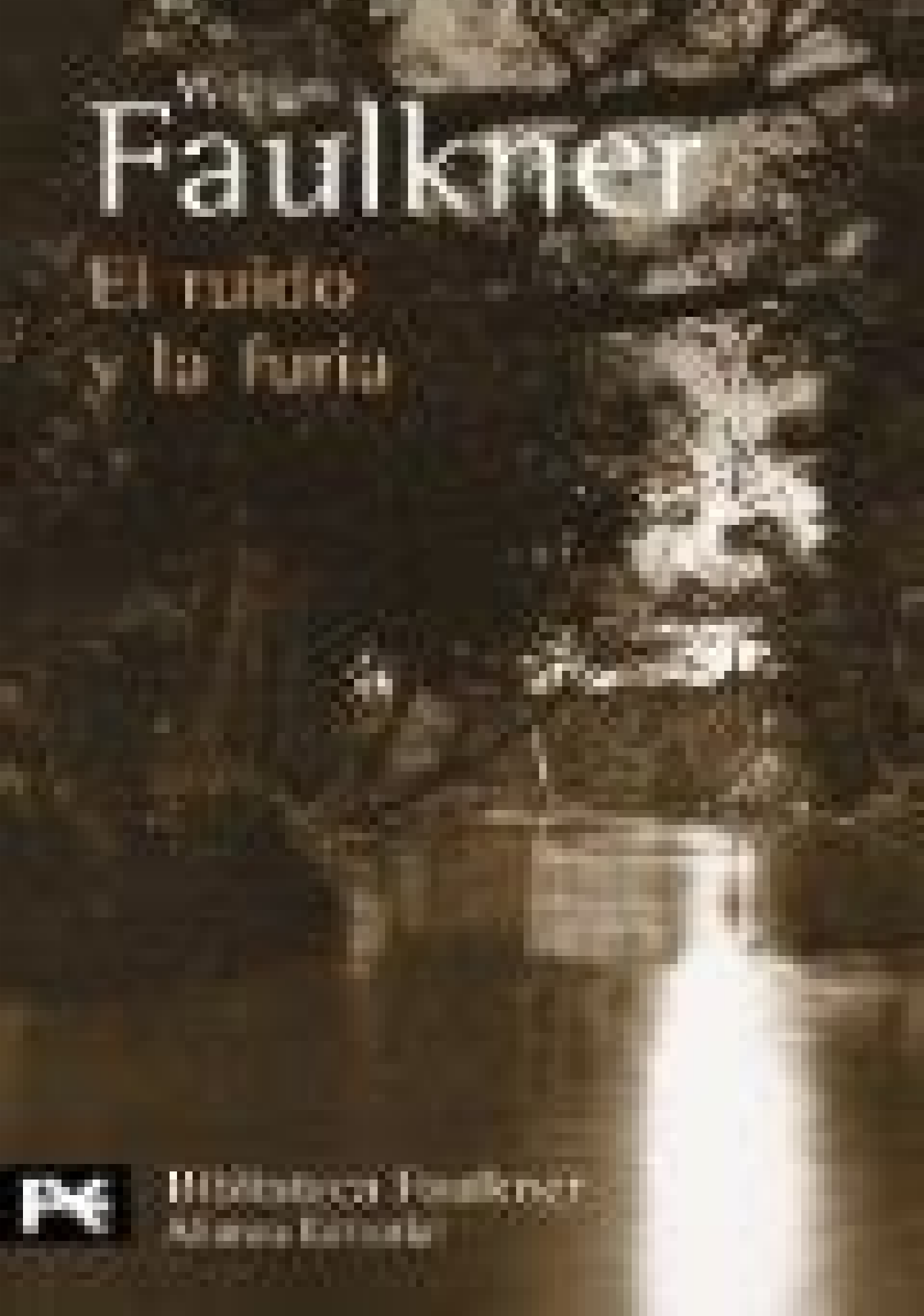
El ruido y la furia película 2014. El ruido y la furia película.